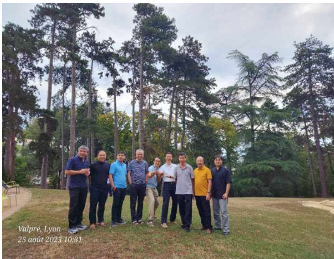
Valpré, Lyon 25 août 2023 10:31