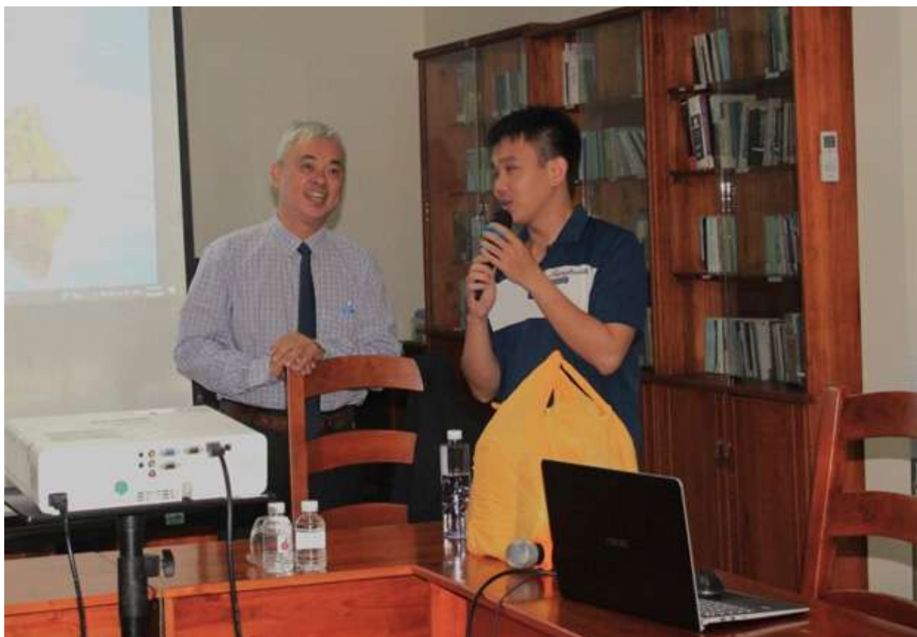
Chia sẻ đến mọi người cùng đọc

The conference ended with gratitude for each other. Moreover, each brother also had more joy in receiving a small gift from the Pastor. The series of Interreligious Dialogue activities will continue throughout the academic year at the scholastic community of Emmanuel d'Alzon of Fatima-Binh Trieu as a cross-cutting theme. We hope that through these sharing sessions, each brother will gain more knowledge about other religions so that we can cultivate our preparations to live closer to the charism of the Congregation.