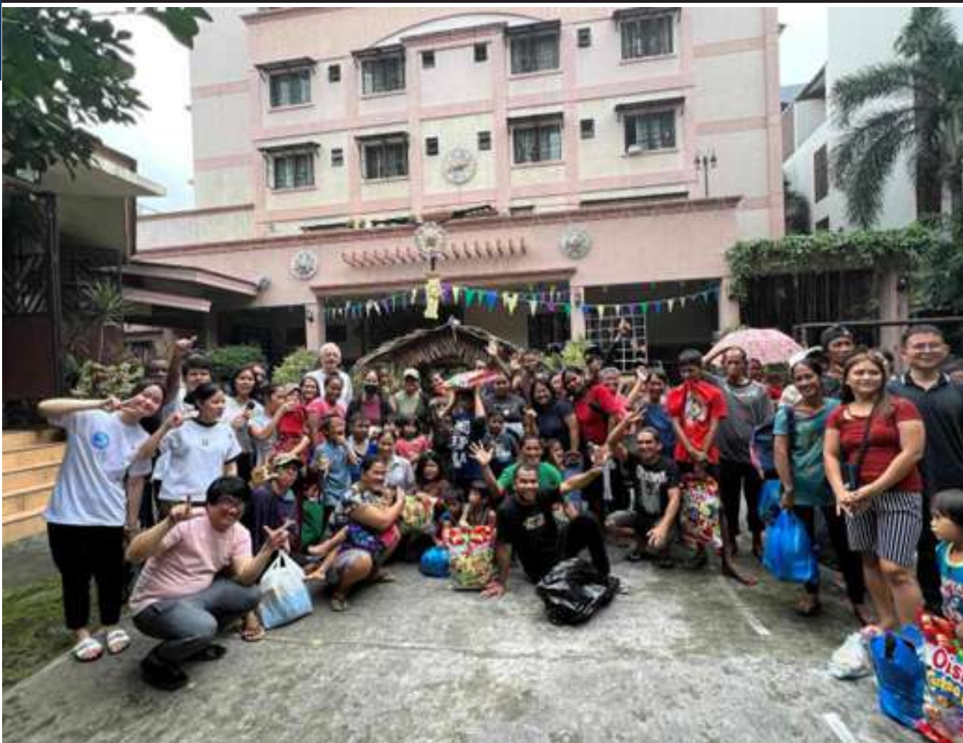
Our special participants with the Assumptionist brothers and ALC residents.