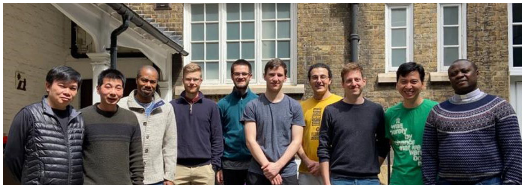
Bethnal Green Community 2020