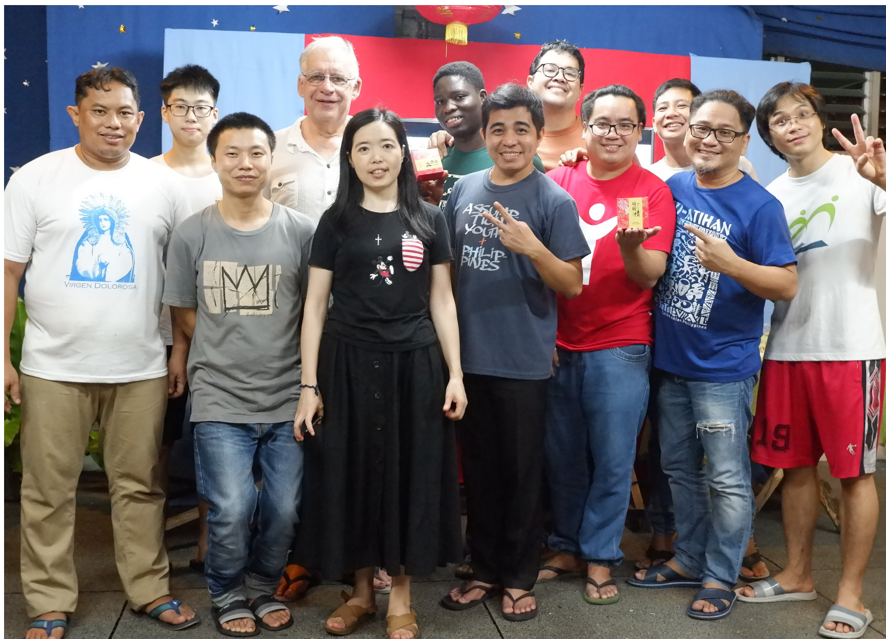
Assumptionists brothers, residents and guest celebrating the festival and sharing the moon cakes

Christian del Mundo, AA, Adveniat, Manila